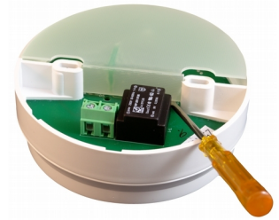
Figur 3: Løft deksel med skrutrekker