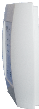
Ytre mål i cm: L=20, H=20, B=4