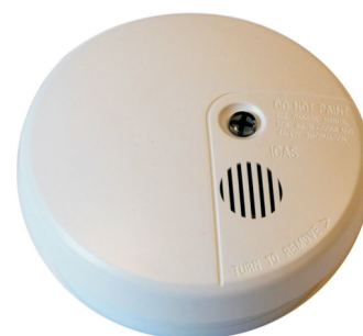
Icas Branndetektor: 500-IDx (x=O, I, T) O: Optisk, I: Ionisk, T: Termisk Sirene integrert: 85db/3m

Enkel montering: Kun 2 ledere fra sentral til detektorer. Bruker du detektorene 500-IDx, bruk 4 ledere for å benytte deg av den integrerte sokkelsirenen.