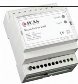
Power m/backup, uPU