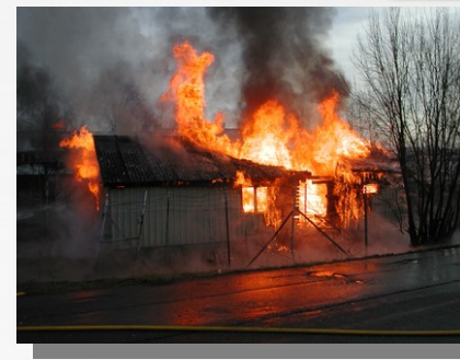
Etter nye 4 minutter er huset overtent, og du brenner inne.