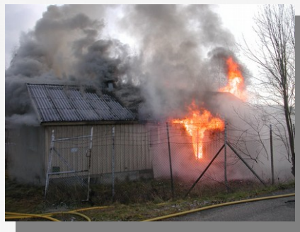
Etter nye 50 sek. kan du bare rømme ut soveromsvinduet.