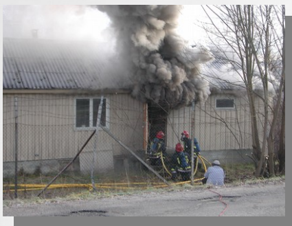
Etter 90 sek. kan du gå ut døren. Stue til høyre, soverom til venstre.