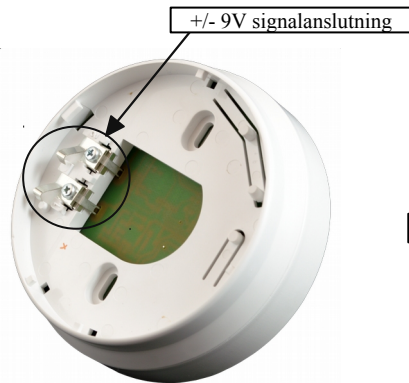
Figur 1: Chor-WS, radiomodul sockel