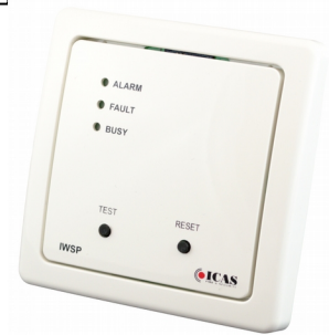
Figur 3: IWSP, kontrollpanel