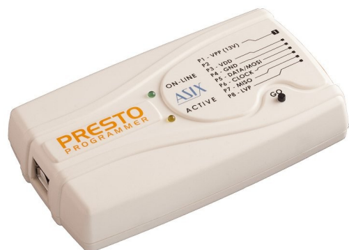
Figur 1.: Varenr. 998.010001 - Presto