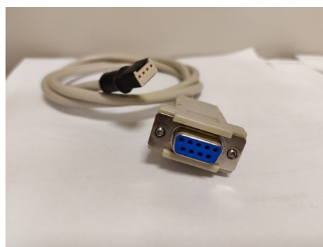
Figur 4.: Varenr. 998.010004 - UCAB/IRS