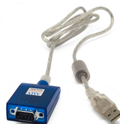
Figur 2.: Varenr. 998.010002 - UCAB232