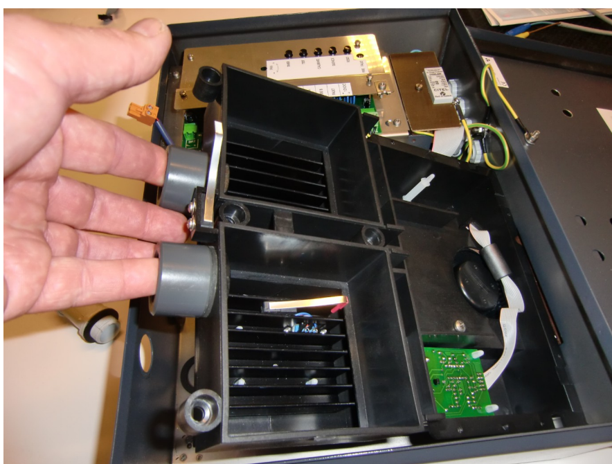
Figur 2: IRS-3 Filterboks, for å komme til bak må man skru ut innføringer og løsne noen skruer på siden, samt å skyve den litt mot utløpet.