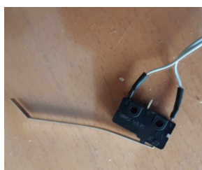
Figur 3: Filter og filterlokk bryter